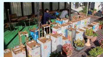
行燈の紙はがしと枠洗ひ

野添コミセンは昨年に続き「トライやる・ウィーク」活動に協力し、播磨中学校生徒1名を11月6日～10日の5日間受け入れました。コミセンの職員とボランティアの皆さんが、毎日さまざまな仕事を指導し、生徒は一生懸命与えられた作業に打ち込んでいました。文化の集いの準備と他にもいろいろな作業をしてもらうことで野添コミセンがどんな取り組みを行っているのかを実感してもらえたのではないかと考えます。今回の体験が生徒の将来に少しでも役立つことを願っています。