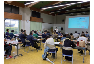
上映会とワークショップの様子

昨春スタートした高齢者むけスマホ教室は、本年度は令和5年度東播磨地域活動応援事業の補助金を活用しています。毎月第3土曜日に開催され、高齢者の居場所としても、なくてはならない取り組みになっています。